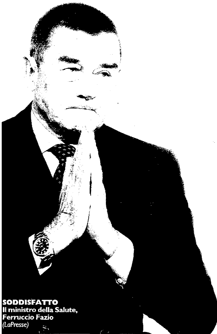
SODDISFATTO Il ministro della Salute, Ferruccio Fazio