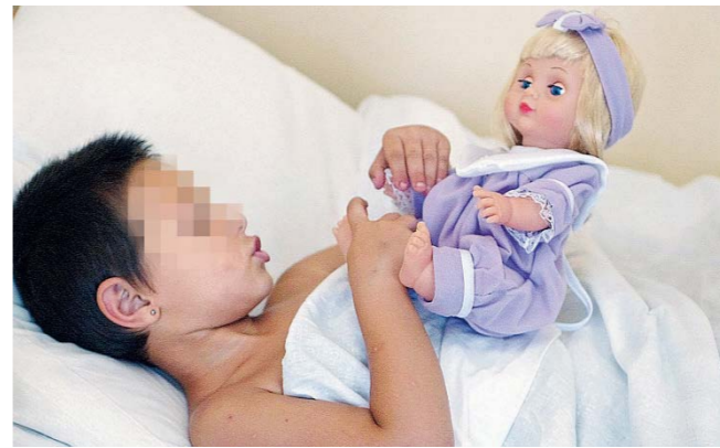
In Italia il 60% dei bambini "terminali" muore in ospedale

of Sciences". La ricerca mostra che i fratelli gemelli identici, che hanno Dna uguale al 100%, hanno la stessa capacità di essere fisionomisti, quindi se uno è bravo a ricordare i visi anche il fratello gemello lo è. Invece i gemelli non identici, che hanno Dna simile ma non uguale, possono avere abilità diverse a ricordare e riconoscere un viso.