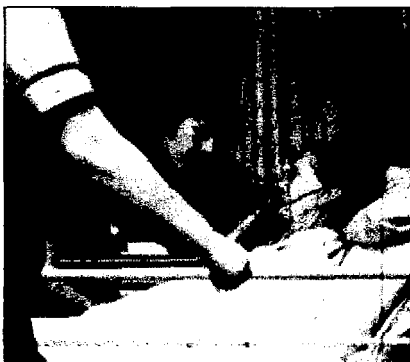
I posti letto negli Hospice saranno 400

La Sicp per conto della Regione ha redatto il piano di realizzazione della