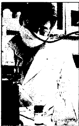
Ricerca e medicina