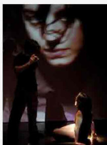
Al Teatro Europa si va in scena con L'Absolution