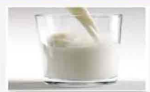
Primo giugno giornata mondiale del latte