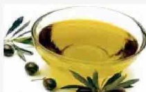
Olio: dall'Unione Europea nessuno sdoganamento