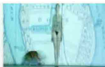
Teatro Lenz, spettacolo l'Isola dei cani